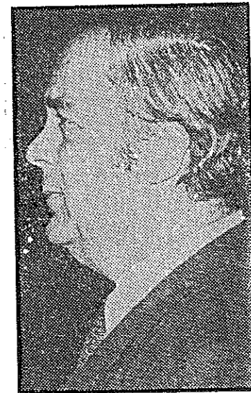
ADV. GEORGE BIZOS